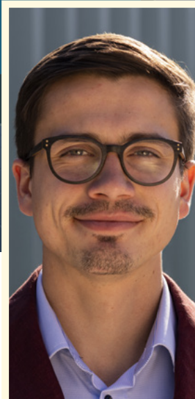
František Taliř náměstek ministra životního prostředí